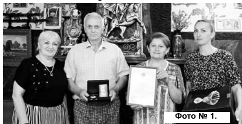
Фото № 1.