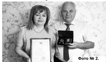
Фото № 2.

Совсем недавно мы отметили замечательный праздник — День семьи, любви и верности. Символ праздника — ромашка, а общественная награда — медаль «За любовь и верность». На одной стороне изображена ромашка, на другой — лики святых Петра и Февронии Муромских.